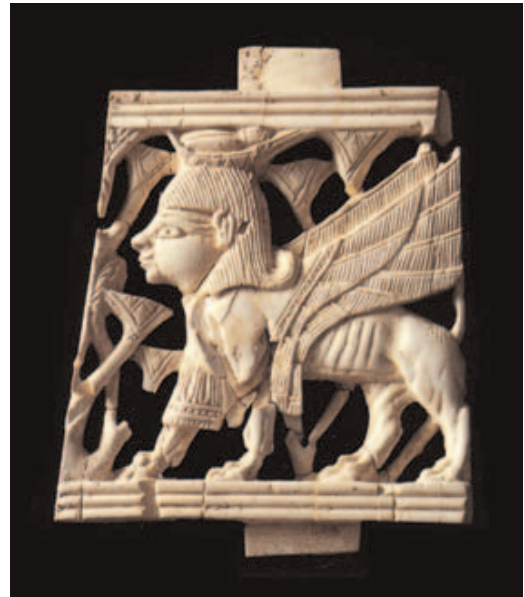
Abb. 186: Schreitender Sphinx mit Flügeln. Dieses Mischwesen ähnelt den »geflügelten Wesen« oder den Cherubim, mit denen Salomo den Tempel geschmückt hatte.

Heute stellt man sich diese Ch.gestalten vielfach ähnlich wie die geflügelten Mischweser ( kurubu ) vor, die die Ausgrabungen in Mesopotamien und auch in Palästina und Syrien (Elfenbeinschnitzereien) ans Licht gebracht haben.