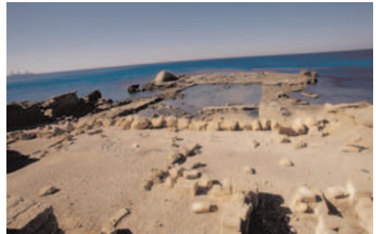
Abb. 184: Herodes ließ seinen Palast direkt in das Meer hineinbauen. Deutlich erkennbar sind die Überreste seines Schwimmbads und des Mosaiks.

In Dan 2,2.4.10; 4,4 kommt das Wort Ch. auch als Bezeichnung für eine bestimmte babylon. Priesterklasse vor, die sich mit Traumdeutung und Astrologie beschäftigte. → Babylonien , → Syrer