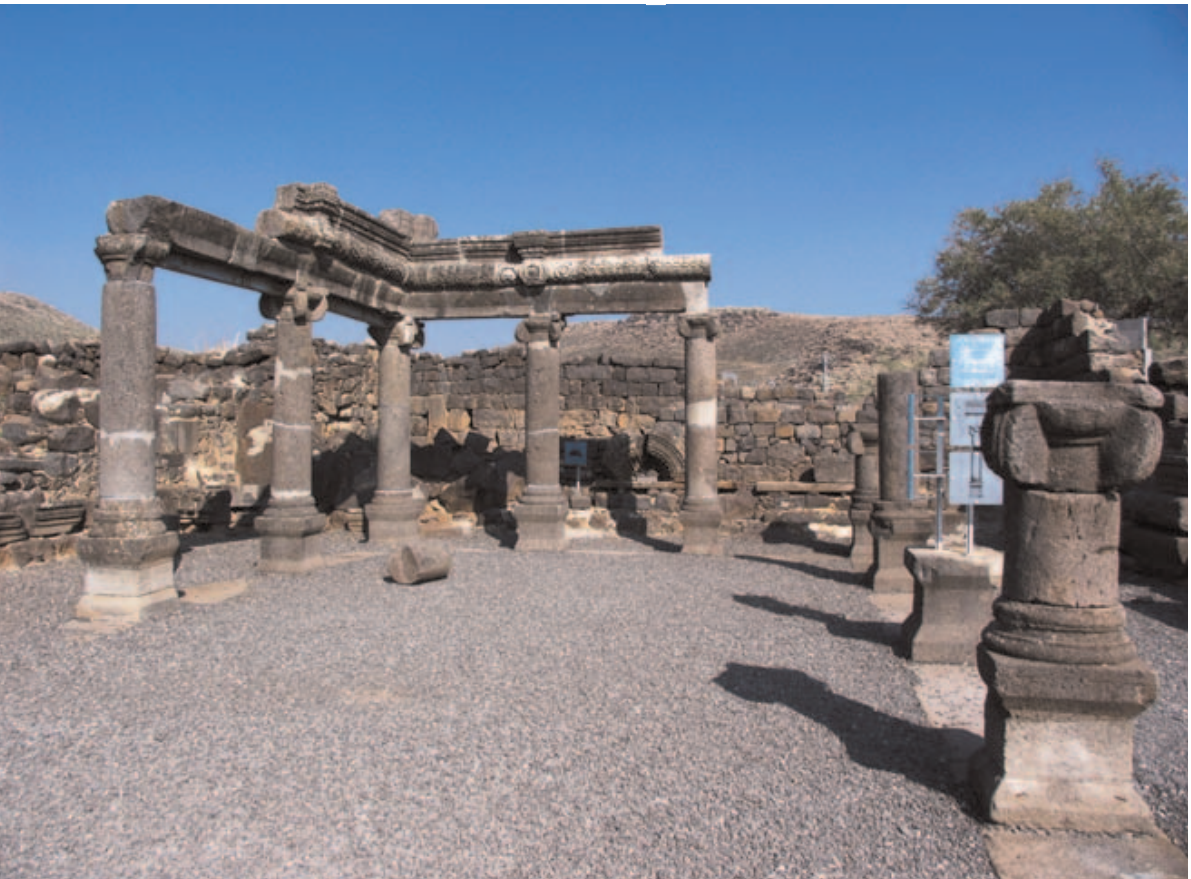
Abb. 187: Reste der Synagoge von Chorazin