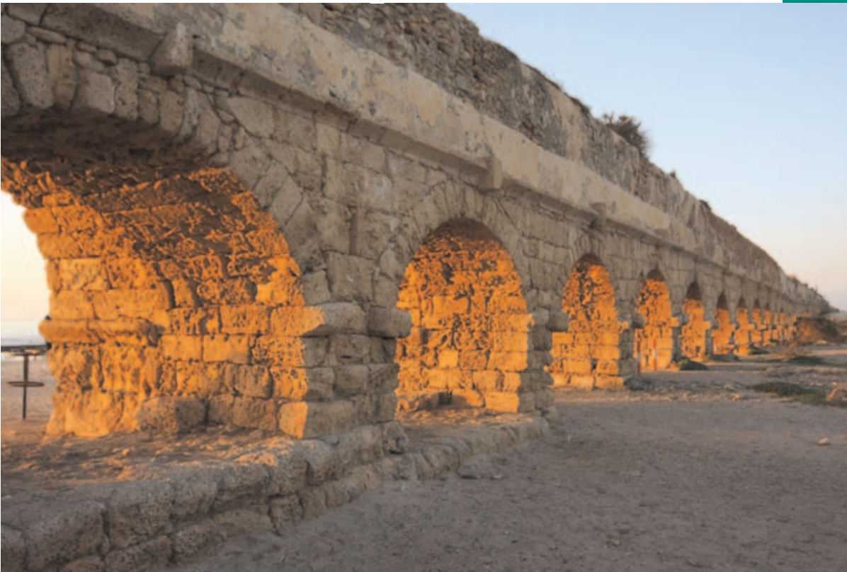
Abb. 182: Das Aquädukt brachte Wasser aus einer 12 km entfernten Quelle nach Cäsarea Maritima.

Cäsarea Philippi liegt im Quellgebiet des Nahr Banyas bei Snir ( 33.242,35.684 ; 6 km westl. von Nimrod), eines der drei Quellflüsse des Jordan. Die Grotte, aus der das Wasser quillt (→ Abb. 185 auf Seite 215 ), war von den Griechen dem Quellgott Pan geweiht (daher der Name Paneas, arab. banyas ). 20 v.Chr. erhielt Herodes d.Gr. dieses Gebiet und baute hier zu Ehren des Augustus eine Stadt. Nahe beim Altar des Pan errichtete er einen Marmortempel mit dem Standbild des Kaisers. Der Vierfürst Philippus verschönerte ab 3 v.Chr. die Stadt und nannte sie