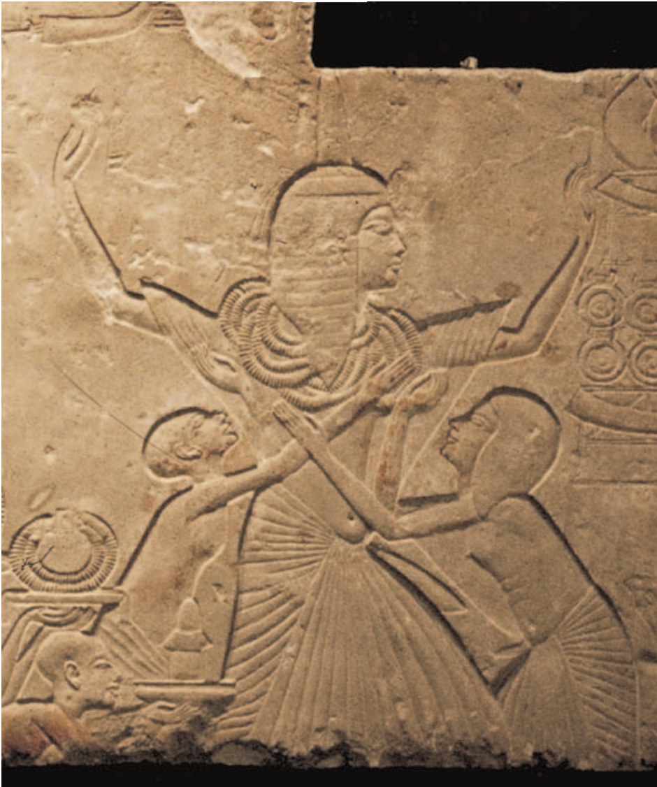
Abb. 191: Relief aus dem Grab von Haremhab in Saqqara bei seiner Ernennung zum Vizekönig (14. Jh. v.Chr.). Er wird mit Goldschmuck behangen und mit Leinen angezogen