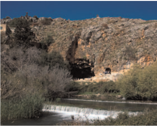
Abb. 185: Grotte bei Cäsarea Philippi, wo einst eine der Jordanquellen entsprang, die heute etwas unterhalb ans Licht tritt. Im Vordergrund befand sich ein Tempel für Kaiser Augustus.

Cherubim 1) Die Cherubim (Plur. von Cherub) werden in der Bibel deutlich von den übrigen Engeln unterschieden. Während diese als »Boten« des Herrn mit den verschiedensten Aufgaben betraut und überall anzutreffen sind (1Mo 28,12; 32,2; Ri 2,1-4; Ps 91,11; Mt 18,10; Apg 12,7-10; Hebr 1,14 u.ö.), erscheinen die Ch. v.a. dort, wo Gott persönlich gegenwärtig ist und sich in seiner Herrlichkeit offenbart (vgl. 2Mo 25,17-21; Ps 80,2; 99,1; Hes 1; 10 u.ö.). Erstmals werden sie in 1Mo 3,24 erwähnt, als Gott sie dazu bestimmt, den Baum des Lebens und den Garten Eden zu bewachen. In ähnlich symbolischer Funktion treten sie in 2Mo 25,17-22 auf. Sie werden als schirmende Beschützer der Lade verstanden, die zugleich die sichtbare Basis des unsichtbaren Thrones Gottes bilden (1Sam 4,4; 2Sam 6,2; Ps 80,2; 99,1 u.ö.).