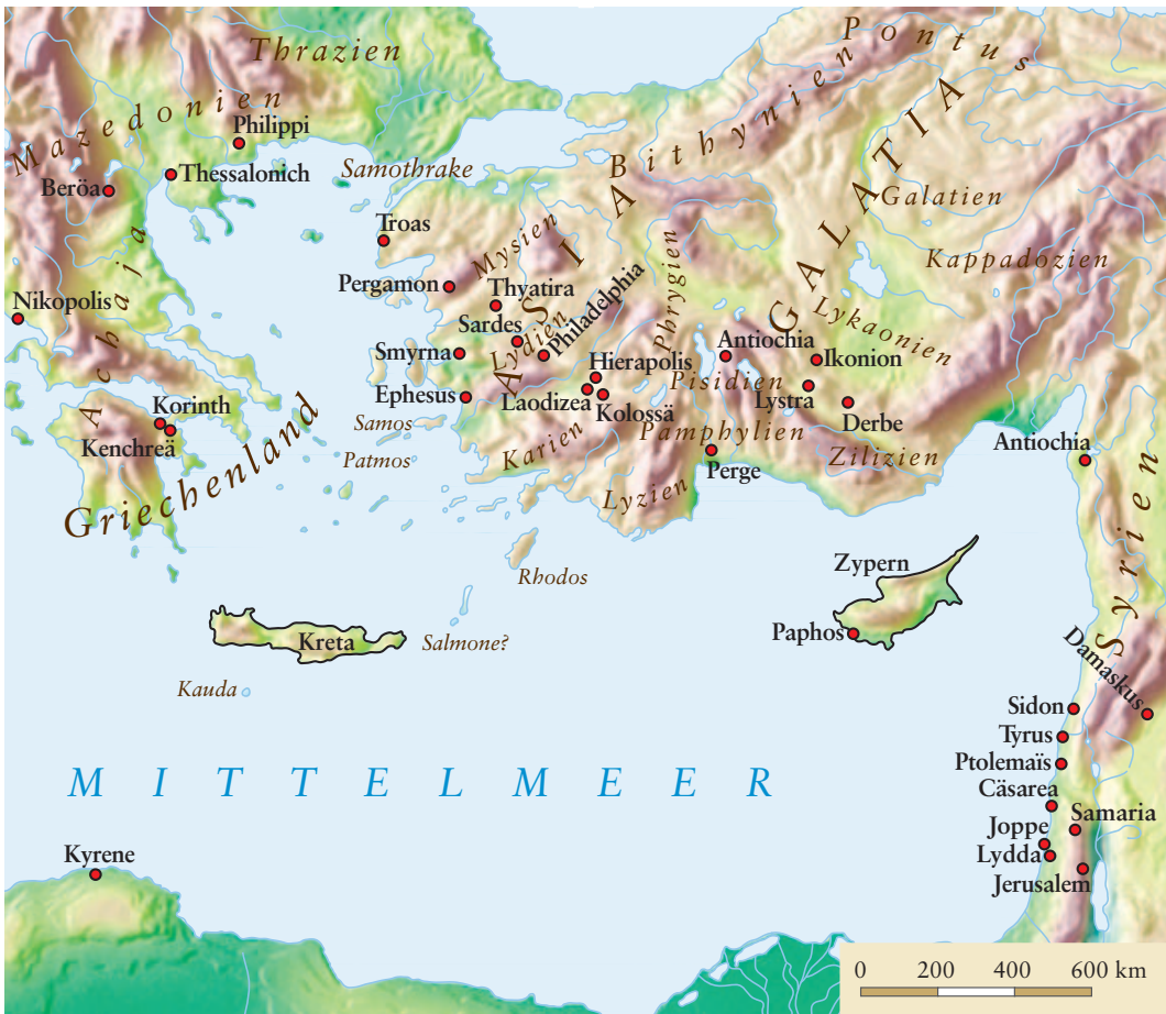
Abb. 189: Verbreitung christlicher Gemeinden in ntl. Zeit: Mittelmeerraum

Frau, die in Ephesus (von wo aus Paulus den 1Kor geschrieben hat; 1Kor 16,8) oder Korinth gewohnt haben kann und nicht unbedingt Christin gewesen sein muss.