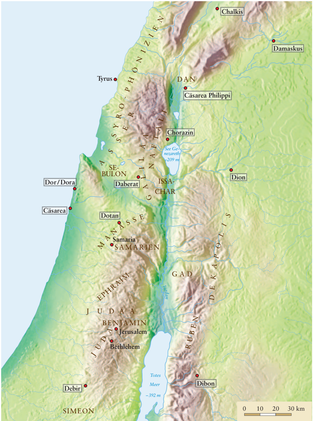
Abb. 190: Ortslagen in Palästina

sein; man hat aber auch halb- oder nichtamtliche Geschichtswerke darunter vermutet. In Neh 12,23 wird eine Ch. genannt, die die levitischen Geschlechtsregister enthielt. → Chronikbücher