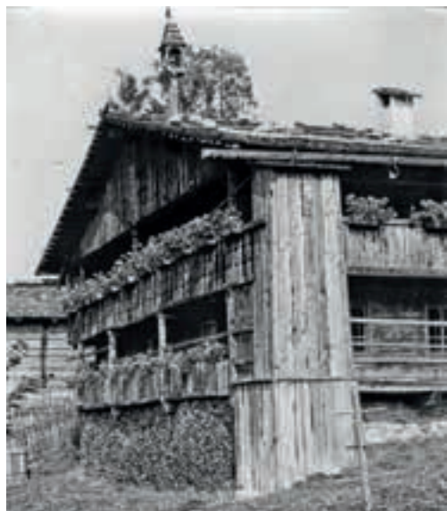
› Der Berghof vom Höfila in Mühlwald steht heute im Volkskundemuseum in Dietenheim.